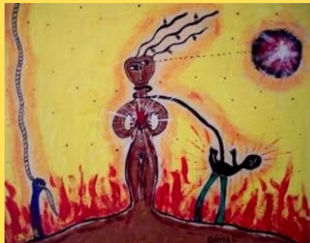
Tierra por Luz